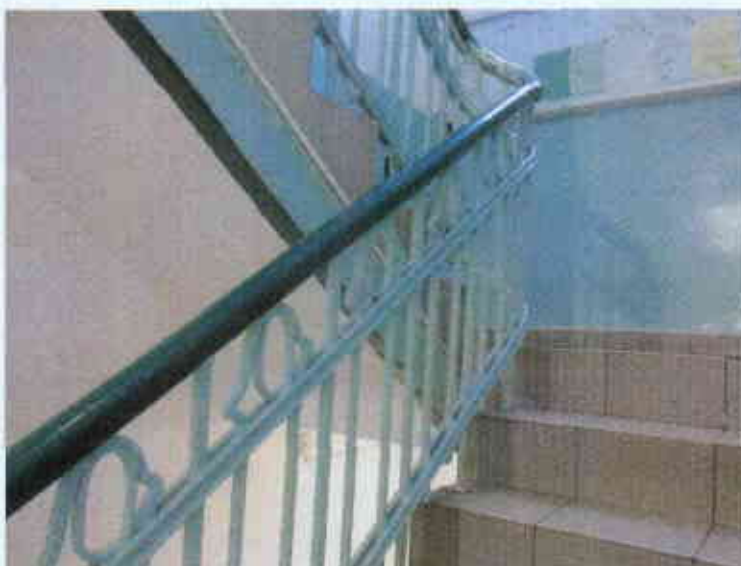
Widok barierek schodowych

Widok odparzonych tynków jako skutek zawilgoconych ścian przy wejściu do klatki bocznej - remont barierek polegający na usunięciu istniejących powłok malarskich i ponownym przemalowaniem farbami olejnymi,