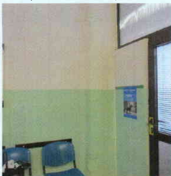
Obudowa starej rury kanalizacyjnej