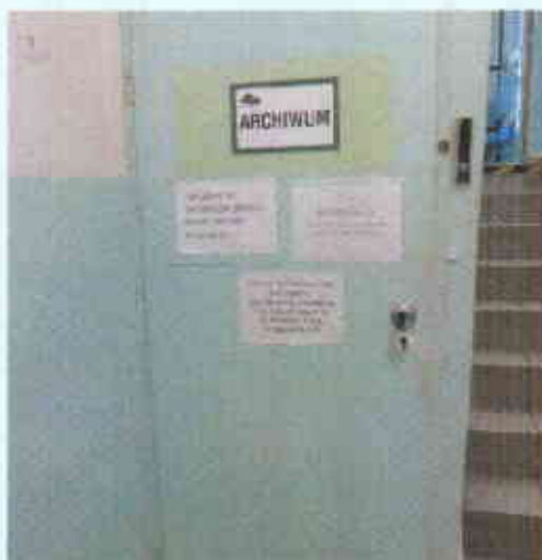
Drzwi do wymiany do archiwom z montażem zamka z kodem dostępu