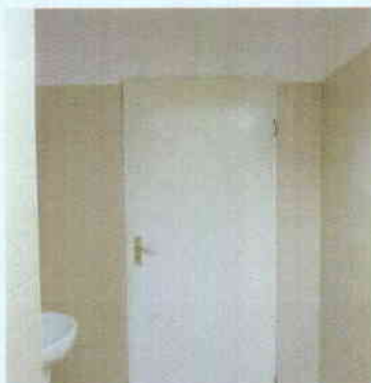
Drzwi do wymiany od strony pomieszczenia WC

uzupełnienie płytek na szerokości, która zostanie uszkodzona podczas wymiany stolarki drzwiowej.