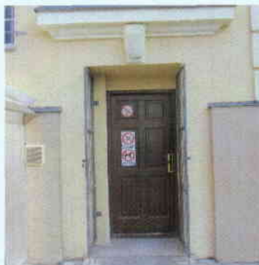
Widok drzwi zewnętrznych i miejsce do montażu daszka systemowego na istniejącym gzymsie