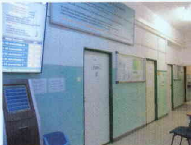
Widok stolarki drzwiowej do wymiany