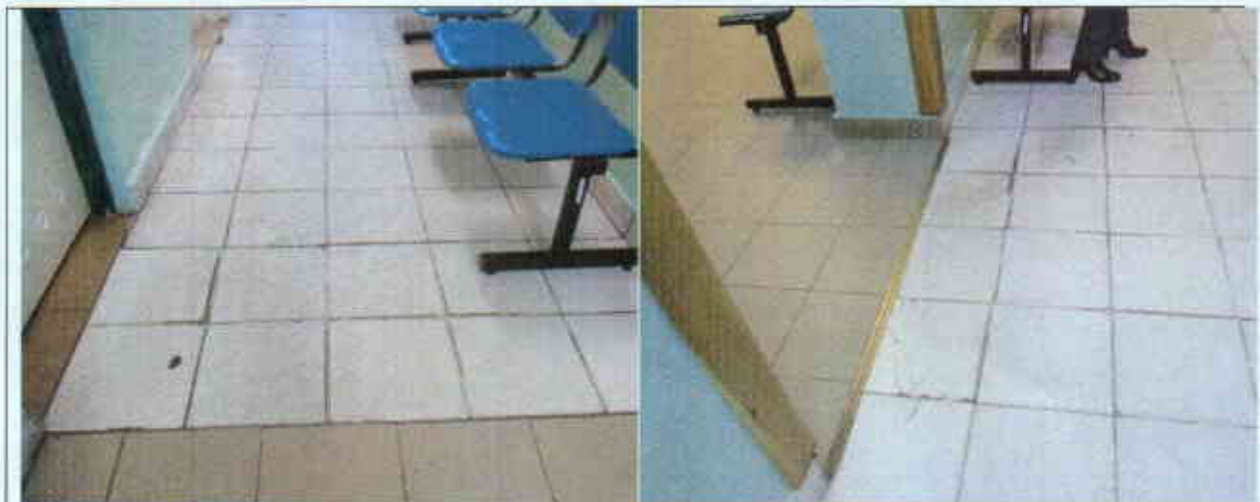
Widok połączenia posadzki do wymiany

- wymiana posadzki w części korytarza – na płytki gresowe antypoślizgowe 30x30 układane na kleju elastycznym – np.: ADESILEX P9 firmy Mapei – kolorystykę płytek należy dobrać do istniejących w pozostałej części korytarza – powierzchnie pod płytki należy odpowiednio przygotować: należy wykonać wyrównanie podłoża uwzględniając skuwanie, szlifowanie i wykonanie warstwy wyrównawczej gr. ok 1cm z zaprawy z wykonaniem warstwy szczepnej, należy wyrównać różny poziom posadzek tak, aby nie było stopni, uskoków ani progów, z wykonaniem cokoliczków wysokości 10 cm z płytek gress,