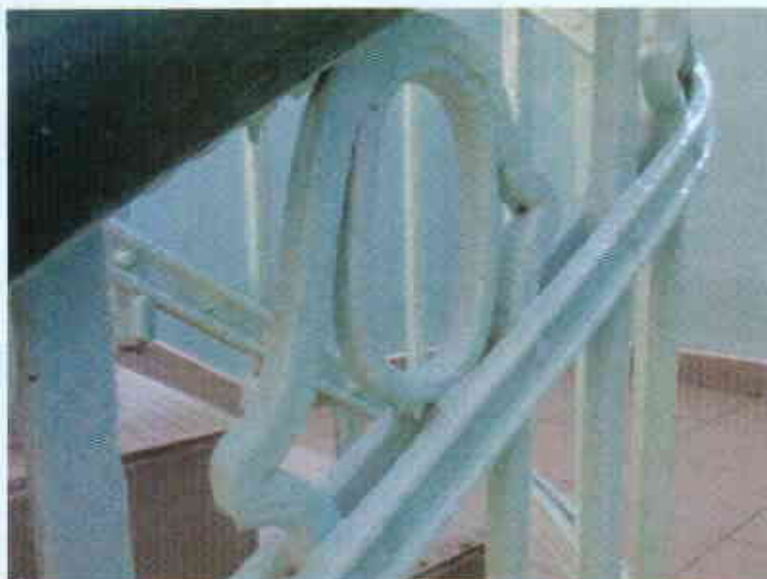
Zacieki po malowaniu farbą olejną do likwidacji.