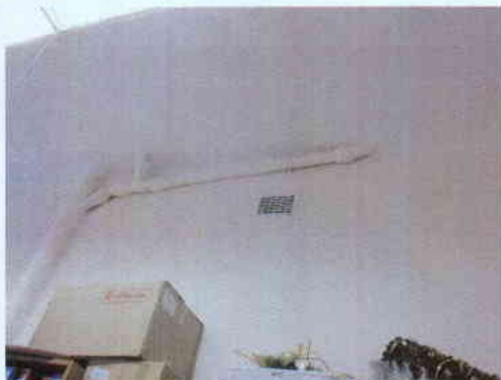
Obudowa rur kanalizacyjnych z przełożeniem kratki wentylacyjnej