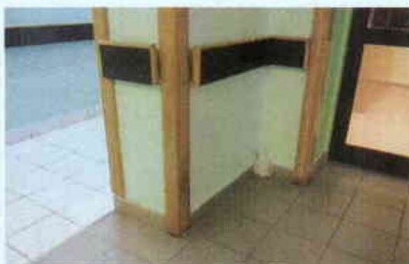
Zabudowa rury z uzupełnieniem cokolików po zdemontowanych narożnikach

- demontaż i montaż stolarki drzwiowej (7 szt.) dobranej na wzór drzwi do sekretariatu z jednym zamkiem patentowym, drzwi wykonane z profili aluminiowych nie będą wymieniane, tylko drzwi płycinowe przewidziane są do wymiany, drzwi do pomieszczeń WC muszą być wyposażone w tuleje wentylacyjne,