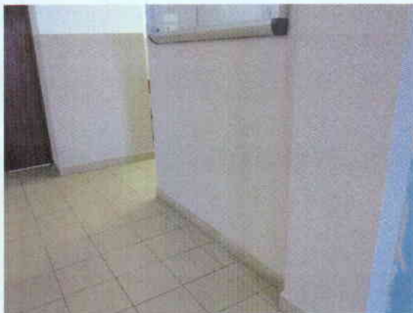
Faktura gramalastu do wykonania w miejsce istniejącej lamperii

- obudowa rury płytą g-k na ruszcie stalowym przy kominie,