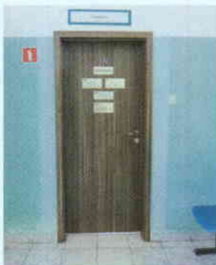
Widok drzwi do sekretariatu jako wzór drzwi wejściowych do pomieszczeń.

- demontaż drzwi pomiędzy korytarzem a klatką schodową główną,