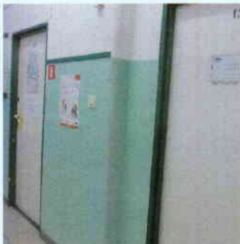
Przykład narożnika do wyrównania